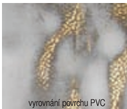
vyrovnaní povrchu PVC